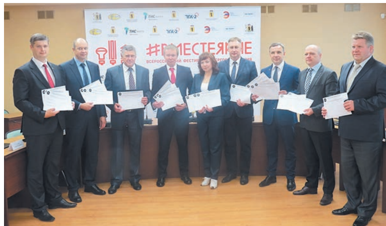
Депутатами Ярославской областной Думы, руководителями энергетических компаний области и другими официальными лицами были подписаны декларации о личном вкладе в повышение энергоэффективности экономики России и петиции в поддержку проекта по переходу на эффективное светодиодное освещение