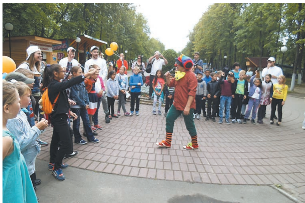
Гостей Даманского также ждали конкурсы, командный квест «Энергопоиск», интерактивные уроки, мастер-классы, викторины