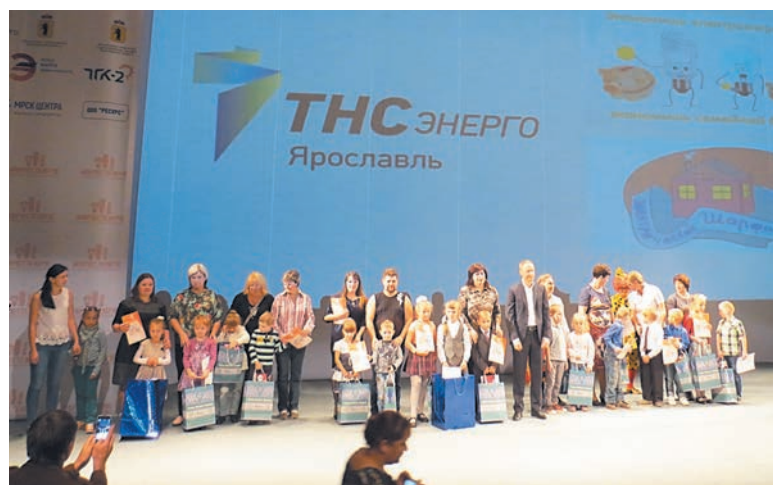
Награждение победителей открытого областного конкурса творческих работ по энергосбережению «Наш теплый дом-2016»