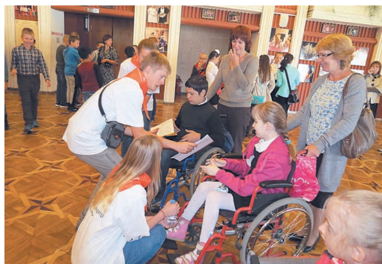
#ВместеЯрче в Театре юного зрителя